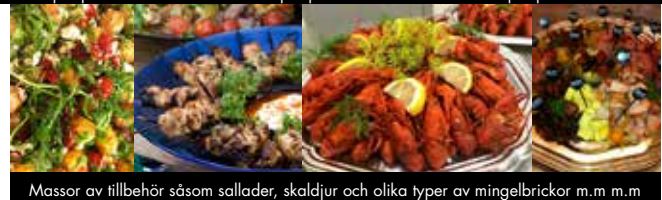
Massor av tillbehör såsom sallader, skaldjur och olika typer av mingelbrickor m.m m.m

– Välkommen hit så komponerar vi tillsammans VANTINGEVÄGEN 15 · FÖRSLÖV · 0431-45 00 58 Se även vår hemsida www.heberleins.se