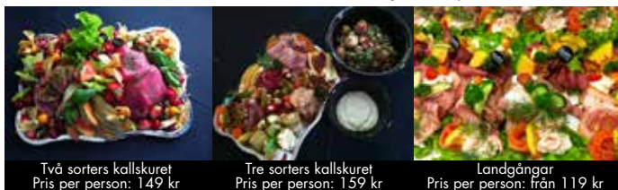
Två sorters kallskuret Pris per person: 149 kr

Ett urval bland våra hemlagade specialiteter