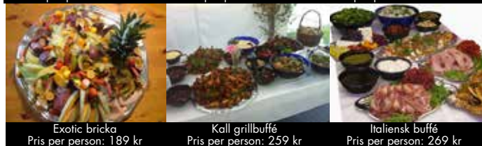
Exotic bricka Pris per person: 189 kr